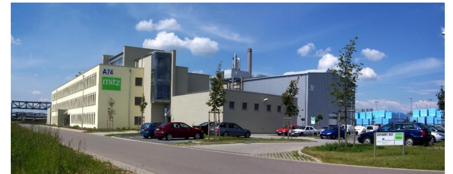
MITZ II - ValuePark® Schkopau