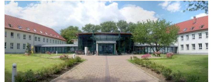
MITZ I - Merseburg

Finanz-und Wirtschaftsausschuss Gemeinde Schkopau_28.03.2023